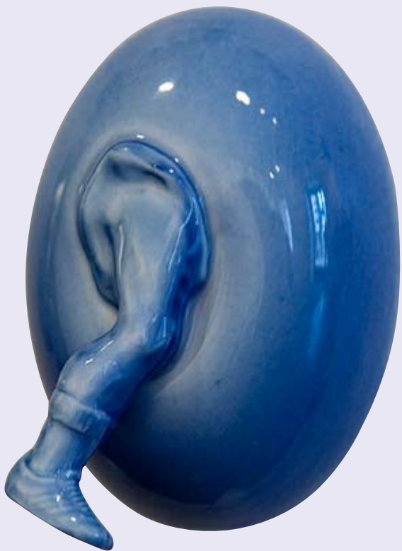
Eggevegg, detalj, 2007