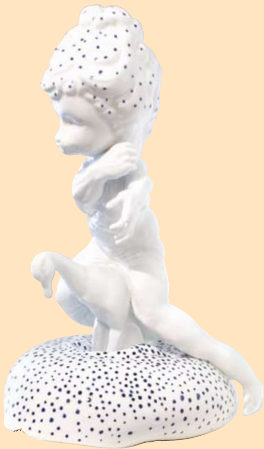
Søstre , detalj, 2007