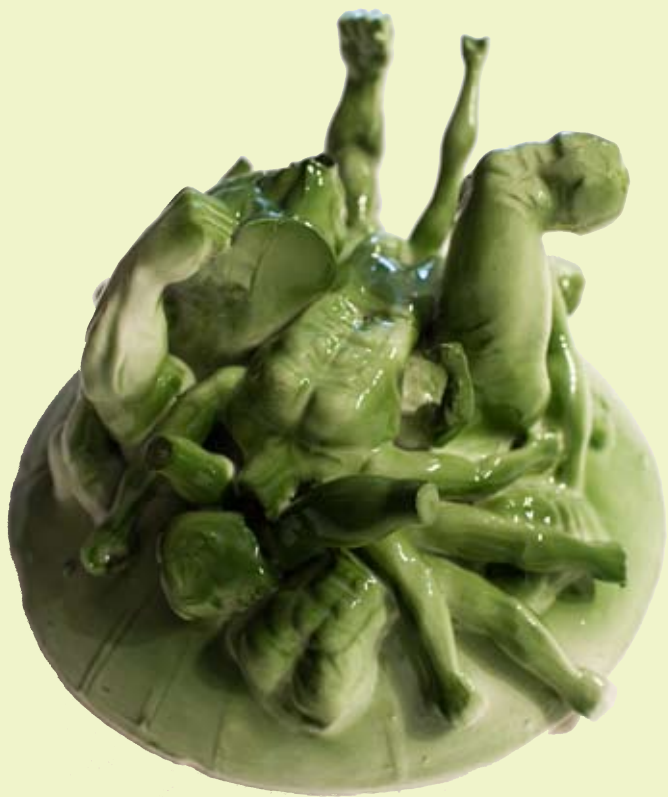
Slagmark i porselen, detalj, 2007