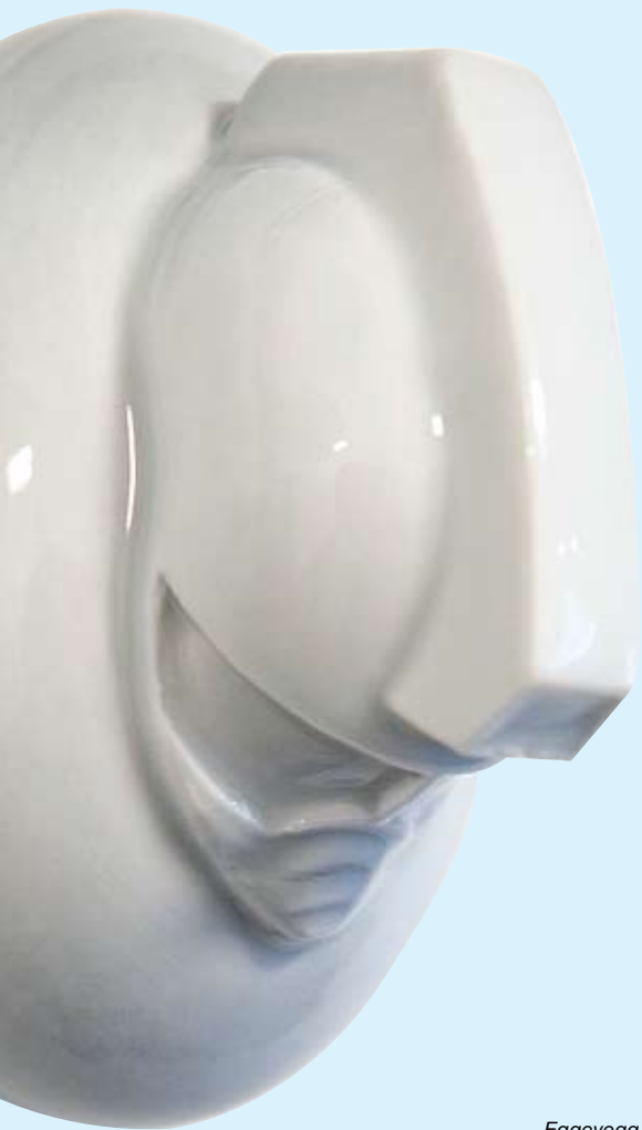
Eggevegg, detalj, 2007