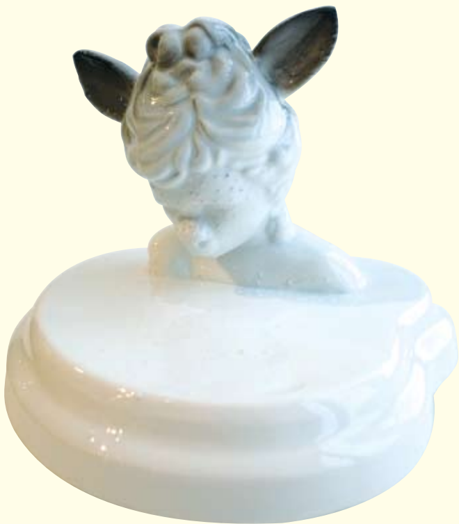
Søstre , detalj, 2007